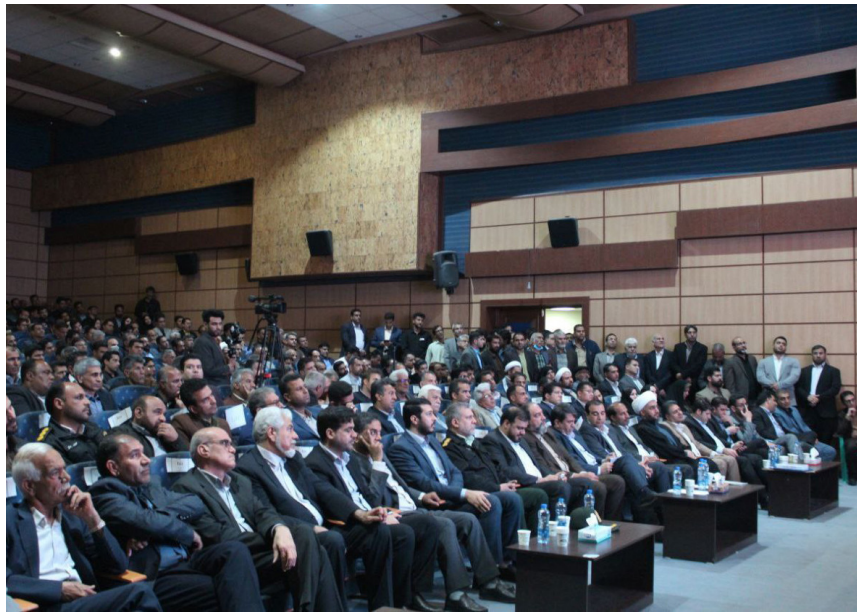
در دیدار سرمربی فوتبال خاتون بزم

فرماندار سابق بزم با اشاره به اهمیت همدلی و همکاری در پیشبرد امور، گفت: «مردم را باید در کنار خودمان داشته باشیم زیرا اگر رستم دستان هم باشیم تنهایی