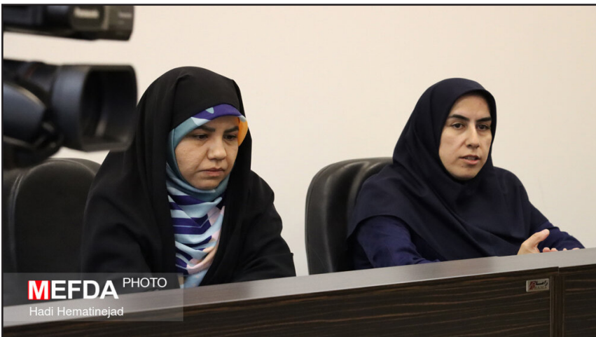
MEFDA PHOTO Hadi Hematinejad