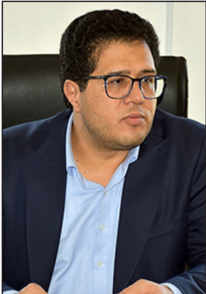
بهره وری و ساماندهی نیروها در دستور کار قرار دارد